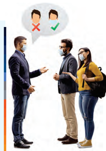
DEPENDÊNCIAS DO LOCAL