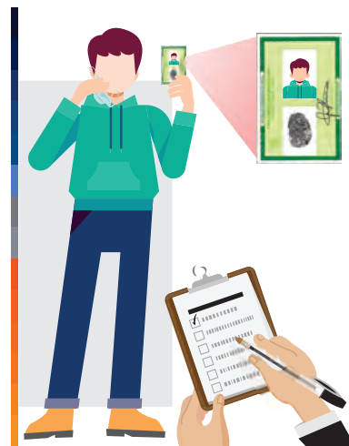
IDENTIFICAÇÃO SEM CONTATO FÍSICO